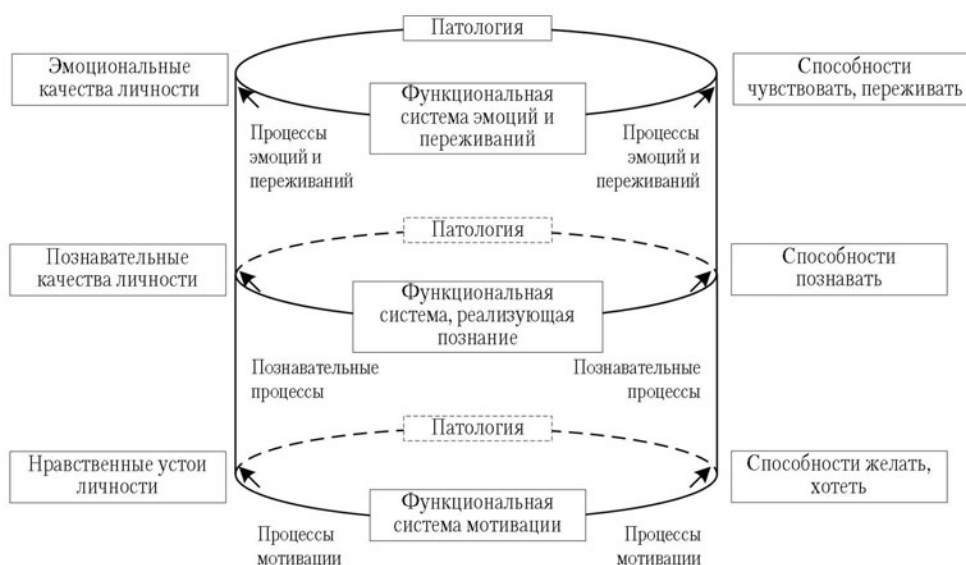
Общая схема взаимодействий психических функций, способностей и личностных качеств