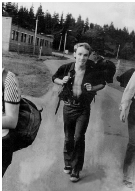
В походе со студенческой группой, 1974

Я хочу навсегда поселиться В стороне захолустной, лесной — Одиночества серая птица Все кружит и кружит надо мной.