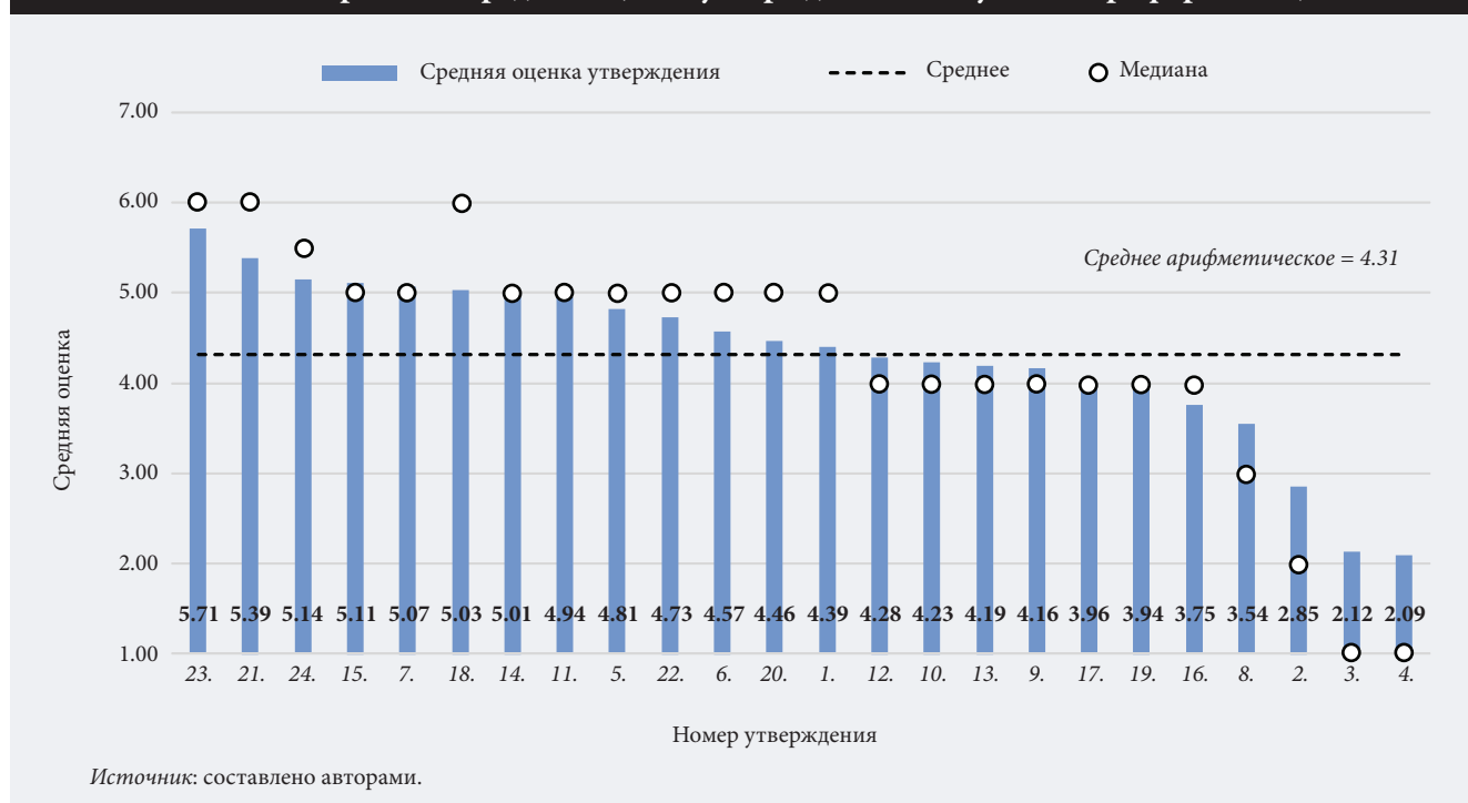
Рис. 2. Ранжирование средних оценок утверждений об обучении профориентации

зрения (утверждение 24) и изучением тематики компетенций и профессий будущего (утверждение 11) со средними оценками 6.62, 6.58 и 6.57 соответственно. Значительные требования предъявляются также к учету в ходе подготовки профконсультантов тенденций научно-технологического развития (утверждение 8), экономической (утверждение 9) и социальной динамики (утверждение 10). Средняя оценка всех трех утверждений равнялась 6.25. Кроме того,