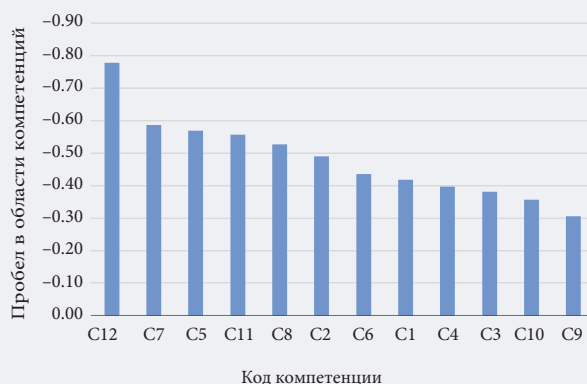
Рис. 4. Ранжирование разрывов между средней оценкой полезности компетенций и средней самооценкой уровня владения компетенциями

Максимальные расхождения выявлены в случаях именно тех компетенций, которыми консультанты владеют хуже всего: C12 — знание моделей наставничества, C7 — способность анализировать тренды и мегатренды, C5 — способность применять творческий подход. Сходный разрыв выявлен в отношении владения инструментами и методами наставничества (компетенция C11). Хотя в целом консультанты обладают достаточной квалификацией в данной области, ее роль в практике профориентации столь вели-