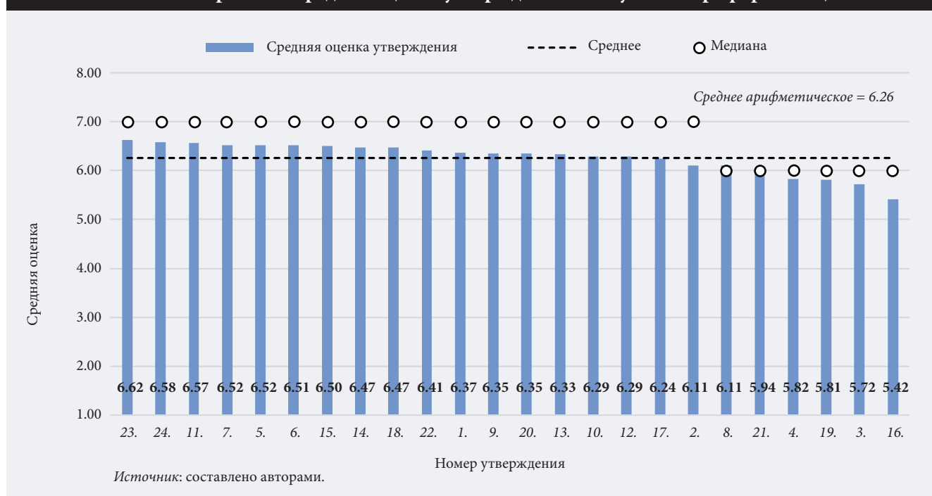
Рис. 3. Ранжирование средних оценок утверждений об обучении профориентации

Анализ полученных данных демонстрирует наличие четырех очевидных разрывов. Самый существенный из них (-3.73) разделяет средние арифметические