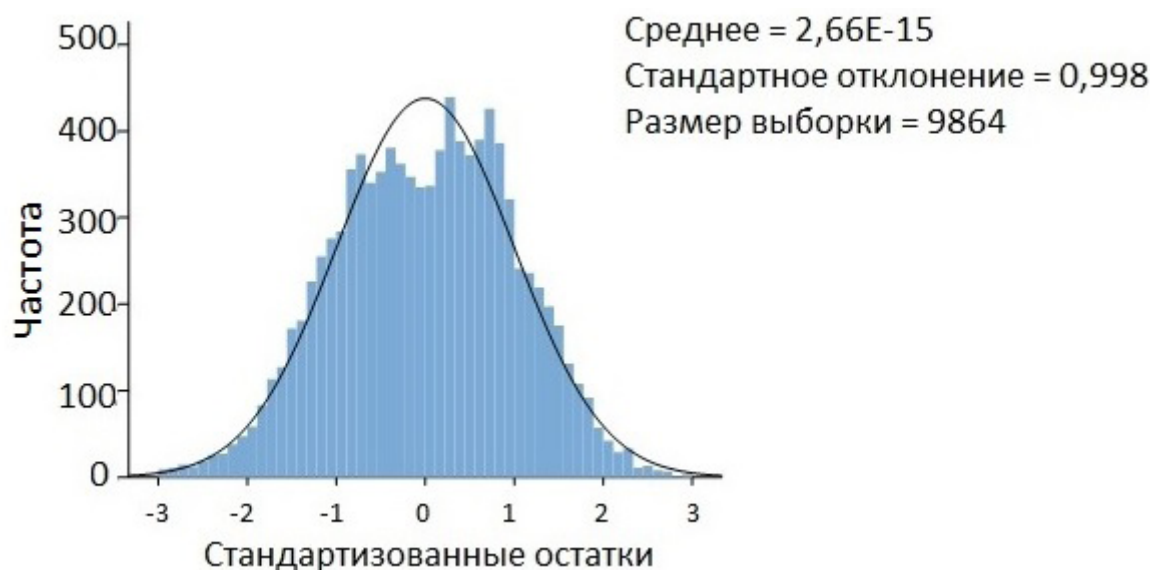
Рис. 1. Распределение стандартизованных остатков

В-третьих, можно судить о нормальном распределении остатков и отсутствии автокорреляции между ними. Рисунок 1 отражает общую тенденцию нормального распределения стандартизованных остатков. И хотя наблюдаются незначительные смещения, общий вид гистограммы позволяет использовать регрессионную модель с данными независимыми переменными.