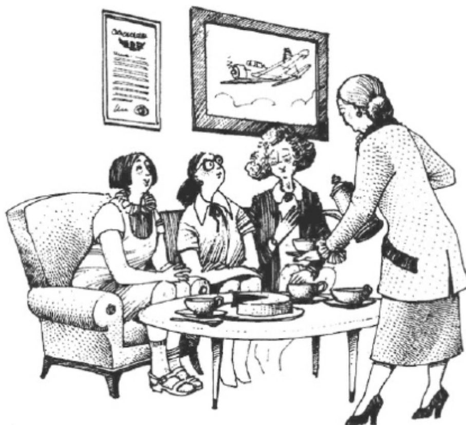
Рис. 1. Сцена из жизни американской армии: жена старшего офицера (обратите внимание на наряд, характерный для псевдовысшего-среднего класса) разливает кофе жёнам младших офицеров

Федеральное правительство отрицает явную иерархию социальных классов, тем не менее признаёт: да, по закону мы все равны, но практически во всех отношениях — нет. Отсюда возникают и 18 категорий государственных служащих — от категории 1 (посыльный и ему подобные), категорий 2 (почтовый клерк), 5 (секретарь), 9 (фармацевт) до категории 14 (юрист) и, наконец, 16, 17 и 18 (управленцы высшего звена). В строительном бизнесе хорошо заметна социальная иерархия занятий: на дне помещается «грязная работа», или, попросту, экскавация; посередине будет строительство канализационных стоков, дорог и туннелей; а на вершине — строительство зданий (чем выше здание, тем выше и позиция строителя). Продавцы «эсклюзивных письменных столов» и дополняющей их офисной мебели знают, что и они, и их клиенты вместе придерживаются жёсткой «классовой» иерархии. Сначала идут столы из дуба, затем — из орехового дерева. Ступенькой выше пойдёт красное дерево — это мебельный «высший-средний класс», если угодно. И наконец, мы приближаемся к верхушке — тиковому дереву. Если же взять социальные функции дам в армии, то разливать кофе — прерогатива супруги старшего офицера, ибо, как знает каждая леди, кофе имеет более высокий ранг по сравнению с чаем.