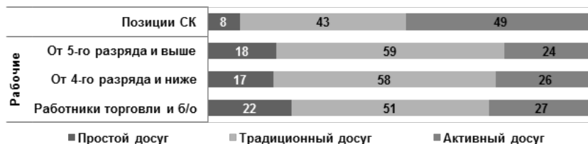
Рис. 2. Типы досуговой активности в различных профессиональных группах россиян, февраль 2014 г., %.

При этом нельзя сказать, что на выбор стиля жизни решающим образом влияет уровень дохода. Среди россиян с доходами свыше 1,5 медиан в соответствующих типах поселений 61 % представителей среднего класса и только 31–42 % рабочих выбирают активные формы времяпрепровождения. К этому стоит добавить, что почти никто (не более 2 %) из представителей всех групп рабочих не занимается в свободное время самообразованием и повышением квалификации, тогда как среди «белых воротничков» такие формы досуга практикует каждый десятый. Это является еще одним свидетельством наличия качественных различий между двумя профессиональными классами в отношении к своим ресурсам и показывает, что российские рабочие не воспринимают свободное время как ценный стратегический ресурс.