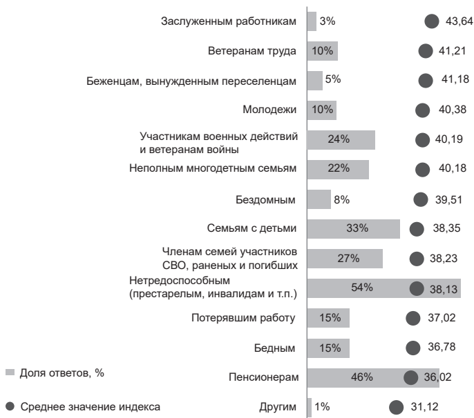
Рис. 2. Индекс проактивности и выбор адресатов государственной поддержки

Сопоставление индекса проактивности с выбором адресатов помощи показывает, что наиболее проактивные респонденты поддерживают меры в отношении заслуженных работников (44 балла), ветеранов труда (41) и беженцев или вынужденных переселенцев (41). Эти варианты не столь массовы, но коррелируют с высоким уровнем инициативности. Более популярные ответы — помощь нетрудоспособным и пенсионерам — демонстрируют более низкие показатели индекса (36), что отчасти объясняется возрастным фактором: проактивность выше среди молодых, тогда как сторонники помощи пенсионерам чаще представляют менее инициативные группы.