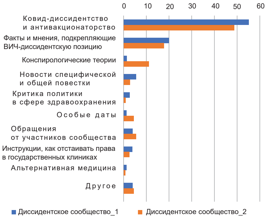
Рис. 3. Распределение тем постов ВИЧ-диссидентских сообществ, доли в %