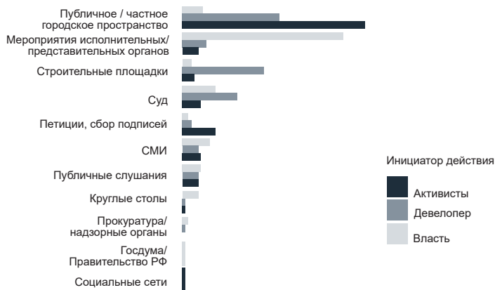
Рис. 2. Распределение использования участниками конфликтов различных арен

Стороны конфликта отличаются по своему репертуару. Активисты организуют публичные мероприятия и сбор подписей, обращаются в органы власти. Представители власти чаще всего предлагают, обсуждают и выносят решения по оспариваемым проектам, проводят общественные слушания, тем или иным образом реагируют на действия активистов. Застройщики инициируют застройку, взаимодействуют с администрацией в части подготовки проектной документации, выдачи разрешения на строительство, а также выступают истцом и ответчиком в судах. Дальнейший анализ может быть направлен на систематизацию и типологизацию действий сторон градостроительных конфликтов.