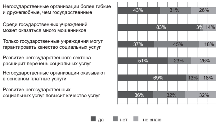
Рисунок 1. Отношение горожан к некоммерческому сектору (N=702), Санкт-Петербург